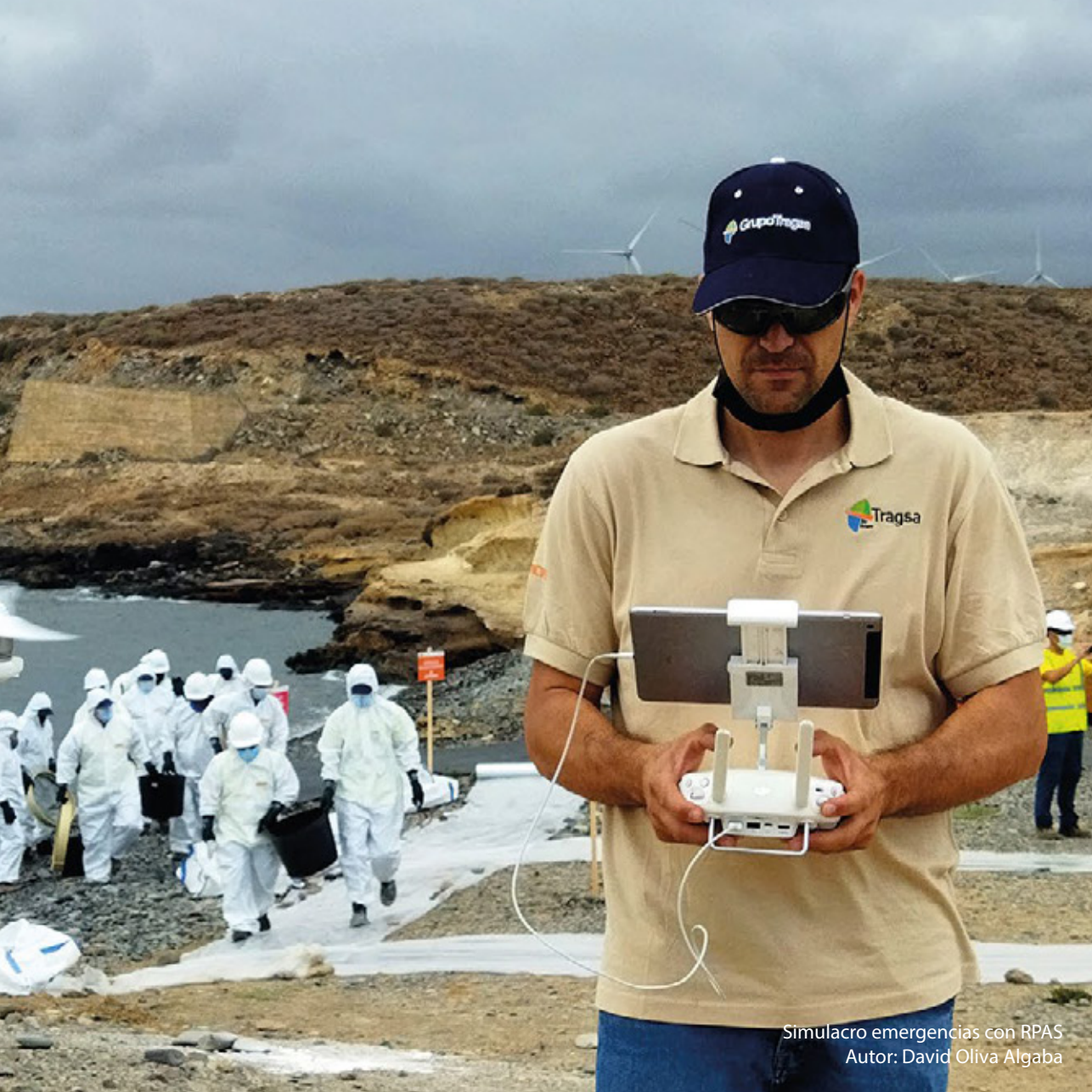
Simulacro emergencias con RPAS