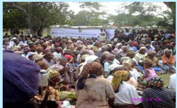
Las comunidades rurales mozambiqueñas han sido beneficiarias directas de las ayudas de la convocatoria 2007.

Las actuaciones formativas desarrolladas por Ayuda en Acción favorecieron la mejora socioeconómica de estas comunidades rurales que vieron reforzadas sus capacidades de gestión y aprendieron a usar de manera sostenible los recursos naturales de su entorno.