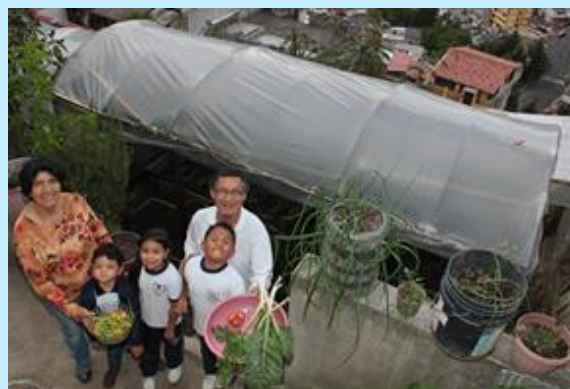
La convocatoria de 2020 dio apoyo a la población más vulnerable, reduciendo su inseguridad alimentaria y mejorando sus ingresos.

Desarrollado por Cruz Roja en Ecuador, ha fortalecido los medios de vida de unos 60 agricultores y agricultoras mediante la puesta en funcionamiento de huertos urbanos ecológicos y la venta de productos agrícolas.