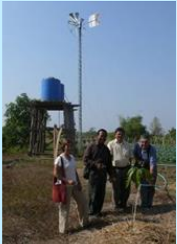
Con este proyecto de 2006 se crearon puestos de trabajo que han beneficiado a campesinos sin tierras y jóvenes discapacitados.

SAUCE (Solidaridad, Ayuda y Unión, Crean Esperanza) , puso en regadío una finca de 29 ha en un área rural camboyana, para explotación de cultivos, con el fin de contribuir a erradicar la pobreza y el hambre. Se construyeron acequias, balsas para cría de peces, vivienda para encargado, almacén, puente, camino e infraestructura de riego.