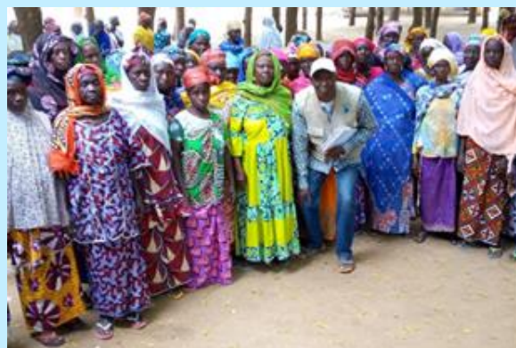
El proyecto de 2021 ha formado e insertado a 80 mujeres en situación de exclusión socio-económica en Malí.

Proyecto ejecutado en Malí por Movimiento por la Paz , dirigido a la inserción de mujeres mediante alternativas formativas y laborales en el sector de la producción hortícola. Indirectamente, más de 4.000 personas resultaron beneficiarias, de las que el 51% son mujeres.