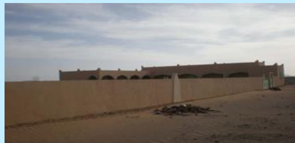
Este proyecto, ejecutado en 2006, permite la escolarización de 200 niños y el acogimiento de familias vulnerables del sur de Marruecos.

La organización Azul en Acción construyó este internado, dotándolo de viviendas e instalaciones, así como del equipamiento necesario para facilitar la acogida: alimentos, ropa, material escolar, etc.