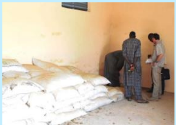
El proyecto de 2017 proporcionó seguridad alimentaria y redujo la pobreza de pastores y agro-pastores en Mali.

Proyecto ganadero desarrollado en Mali por la ONG Rescate Internacional , reduciendo la vulnerabilidad de la pobreza extrema de la zona afectada, en beneficio de las comunidades rurales de Koussane, Djélébou y de Sahel.