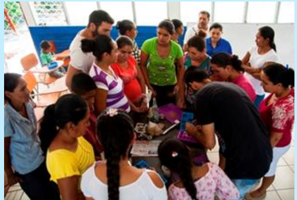
Mujeres rurales e indígenas beneficiarias en 2018 del proyecto "Mujeres en Acción".

Iniciativa de micro emprendimiento de Acción contra el Hambre , como estrategia de empoderamiento de mujeres y jóvenes de las comunidades rurales e indígenas de Madriz (Nicaragua). Más de 120 personas se beneficiaron con este proyecto, siendo 20 mujeres cabezas de hogar y sus familias las principales protagonistas.