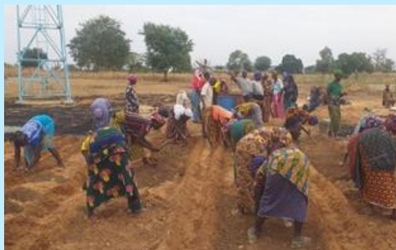
Mujeres agricultoras realizan tareas de siembra en el marco del proyecto beneficiario de 2022, en Malí.

El proyecto desarrollado por la ONG CIDEAL , facilitó formación teórico-práctica a 45 mujeres agricultoras de la Cooperativa KOPROKAF A para fortalecer y mejorar sus capacidades en producción de plántones en viveros.