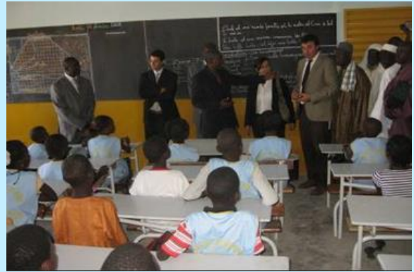
Con la adaptación del Centro CAFT en 2007, se ha mejorado la formación de la comunidad de Thiaroye.

El proyecto realizado por la ONG Solidaridad Internacional ha facilitado formación y educación básica a personas en edad escolar, creando un centro educativo mediante la adaptación de un espacio de trabajo, con aulas, zona de recreo, sanitarios y centro cultural, y ampliando el número de plazas disponibles.