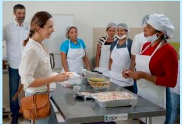
En 2019 se contribuyó al desarrollo de las cooperativas y microempresas de emprendedores rurales nicaragüenses.

Continuación del proyecto de 2018 de Acción Contra el Hambre , en el que se formó a veinte mujeres en procesos de elaboración de conservas y frutas deshidratadas, "packaging" agroalimentario y mejora productiva.