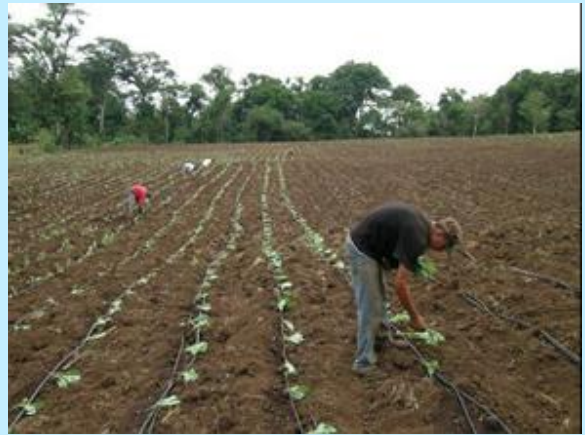
Las infraestructuras de riego instaladas en 2006 resultaron fundamentales para el desarrollo de esta comunidad nicaragüense.

El objetivo de la ONG Ingeniería sin Fronteras ha sido contribuir a reducir la vulnerabilidad ambiental y económica de las familias campesinas de las comunidades de La Concordia, marcada por una cultura extractiva de los recursos hídricos, permitiéndoles reactivar la producción agropecuaria.